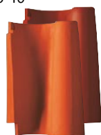
Standardna prirodno crvena bakreno smeđa engoba

Ergoldsbachski žlijebasti crijep Historijski vjeran i izražajan. Svojom mediteranskom notom je idealan za individualno dizajniranje krova i pokrivanje zidova (bez nosa) kod obiteljskih kuća visoke kategorije. Može se polagati suho ili u malteru. • Potreba po m 2 : zavisno od modela • Minimalni nagib krova: po 10°, Uobičajeni nagib krova: po 40°