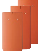
primjeri za razl. oblike