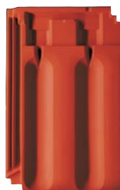
Ergoldsbachski utoreni crijev velikog formata XXL