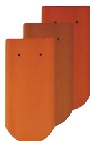
Siena (samo sinterni biber)