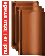
bakreno smeđe engobirano