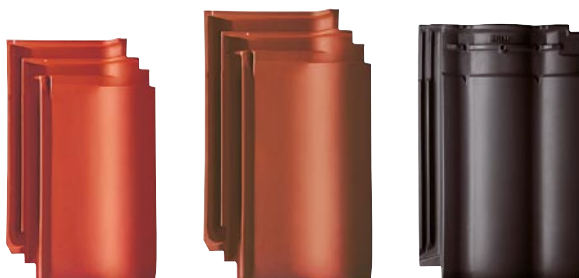
Erlus Lotus® Ergoldsbachski E58, E58 MAX® i Forma®, u bojama lotus crveno, lotus smeđe i lotus crno.