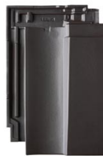
Ergoldsbachski Karat® XXL