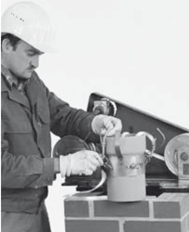
13 Ablasschelle an Kurzrohr anbringen.