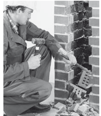
2 Ausstemmen der Anschlussöffnungen am Schornsteinschacht.