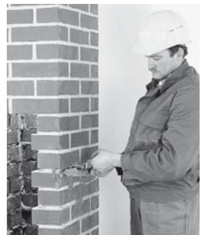
3 Schließen der Risse und nicht benötigter Öffnungen.