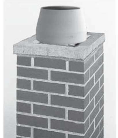
28 Fertiger Schornsteinkopf mit überstehender Abdeckplatte und keramischer Abströmhaube.