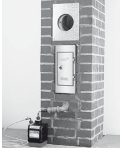
25 Rauchrohranschlussblech andübeln, gegebenenfalls Neutralisationsbox anschließen.