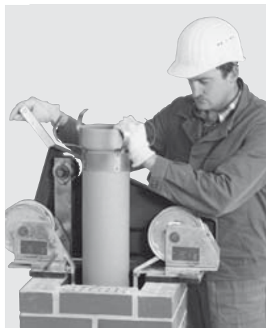
15 Ablassen der ERLUS Edelkeramik® Sanierungsrohr-Säule.