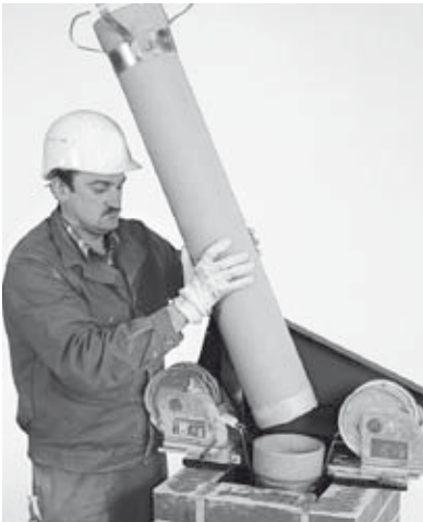
14 Schnellverschluss-Abstandhalter anbringen und versetzen der ERLUS Edelkeramik® Sanierungsrohre.