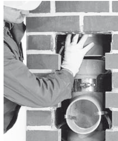
20 Ablassen der Rohrsäule in das Rauchrohrformstück.