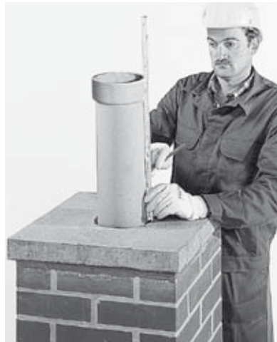
26 Setzen der Abdeckplatte, ausmessen des letzten ERLUS Edelkeramik® Rohres unter Berücksichtigung des Abstandes.