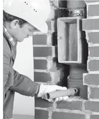
21 Ablaufrohr an die keramische Kondensat-Auffangschale stecken.