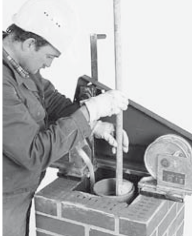
16 Überschüssigen Muffenkitt mit Schwamm aus der Rohrsäule entfernen.