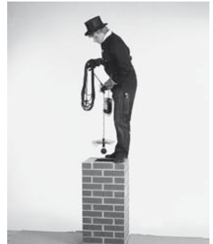
1 Reinigen des zu sanierenden Schornsteines.