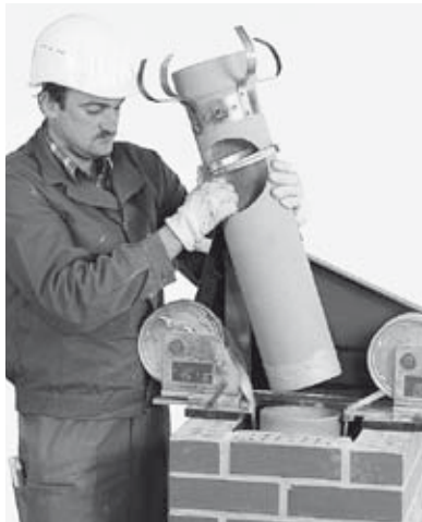
17 Bei Bedarf Edelkeramik Lochteil für Rauchrohr- oder obere Putztüröffnung einsetzen, Stutzenklemmband am Rohr fixieren.