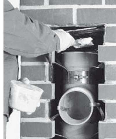
19 Bestreichen der Muffe des Rauchrohrformstückes mit Muffenkitt.