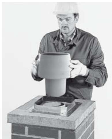
27 Versetzen des letzten ERLUS Edelkeramik® Rohres, aufdübeln der Regenschutzblende und aufsetzen der keramischen Abströmhaube mit Muffenkitt.