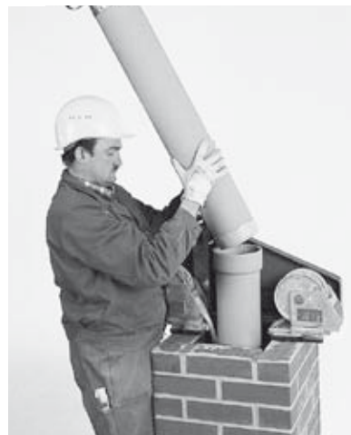
18 Weiteres Versetzen der ERLUS Edelkeramik® Sanierungsrohre.