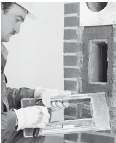
24 Viereckiger Putztüranschluss: Aufbiegen der Fixierlaschen an der Putztür und versetzen der Putztür mit Stutzenkleber oder Muffenkitt. Runder Putztüranschluss: Mantelsteinverschluss einmörteln.