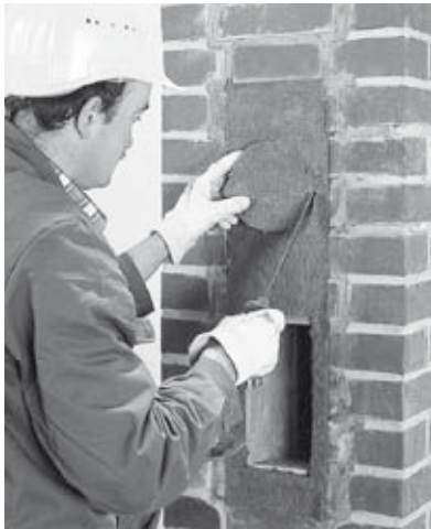
23 Ausdehnungszwischenräume mit Mineralfaserdämmplatten schließen.