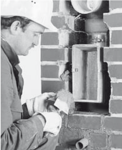
22 Anschlussdurchbrüche ausmauern und begradigen.