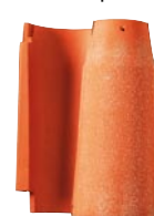
Модел: Замъка на нимфите