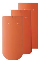
Примери за различни кантове